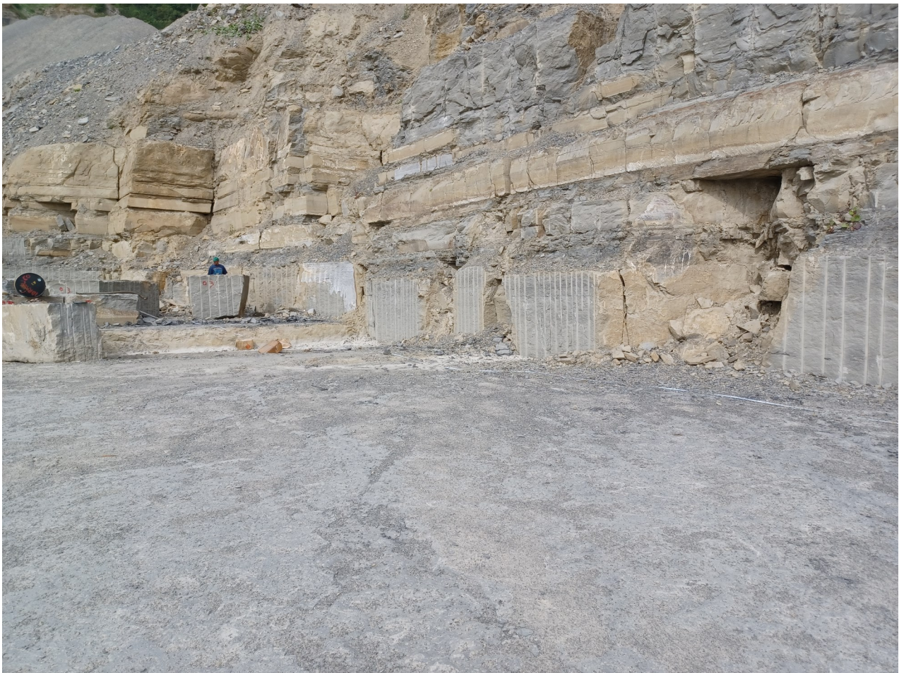
Immagine 12 : vista del fronte di scavo attuale castellina. .