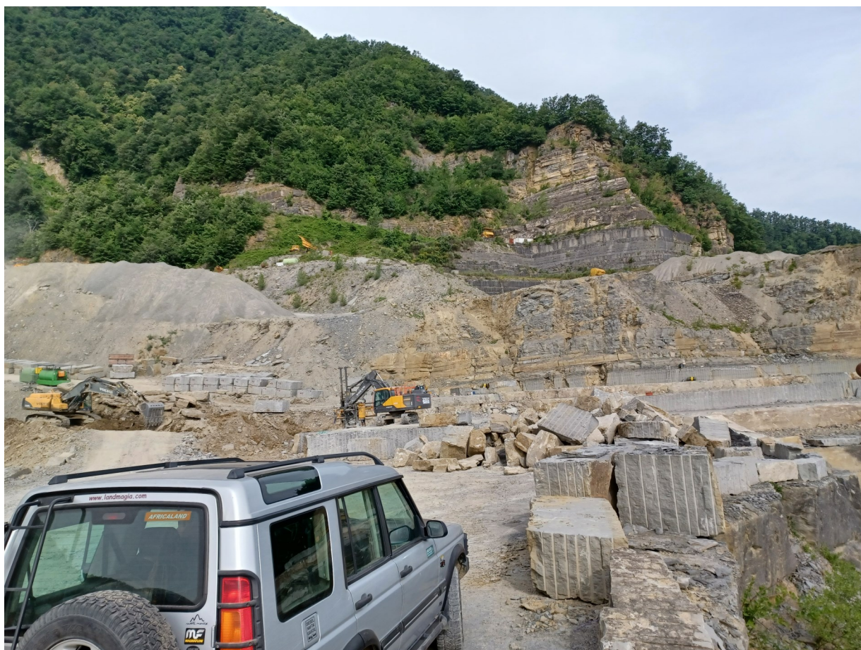
Immagine 2: vista presa dall'ingresso area a cava