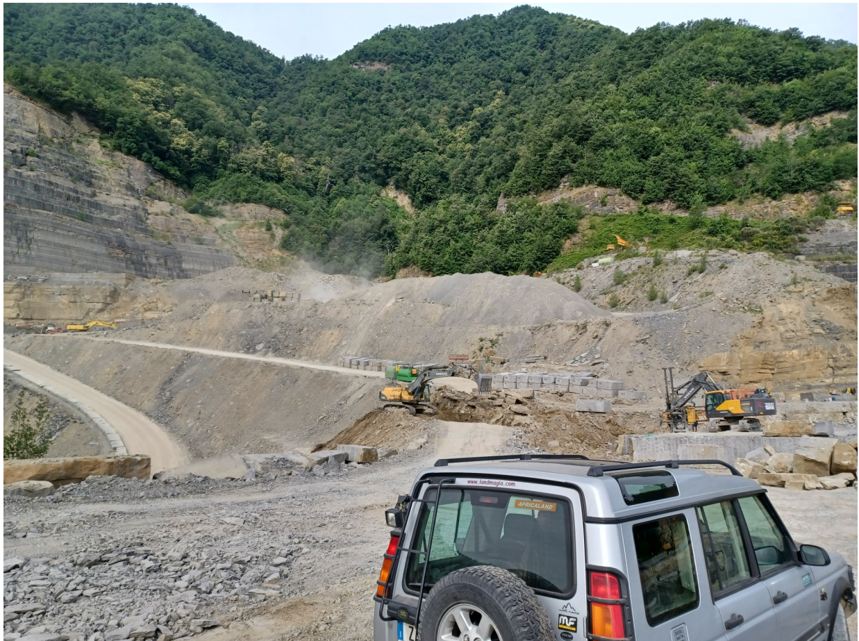
Immagine 4 : vista presa da ingresso cava