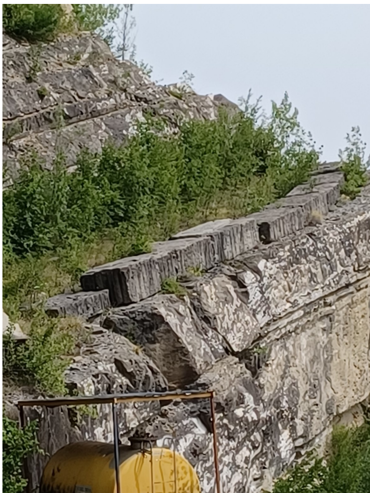
Immagine 7 : dettaglio sui vecchi gradoni con ripristino vegetale in affermazione