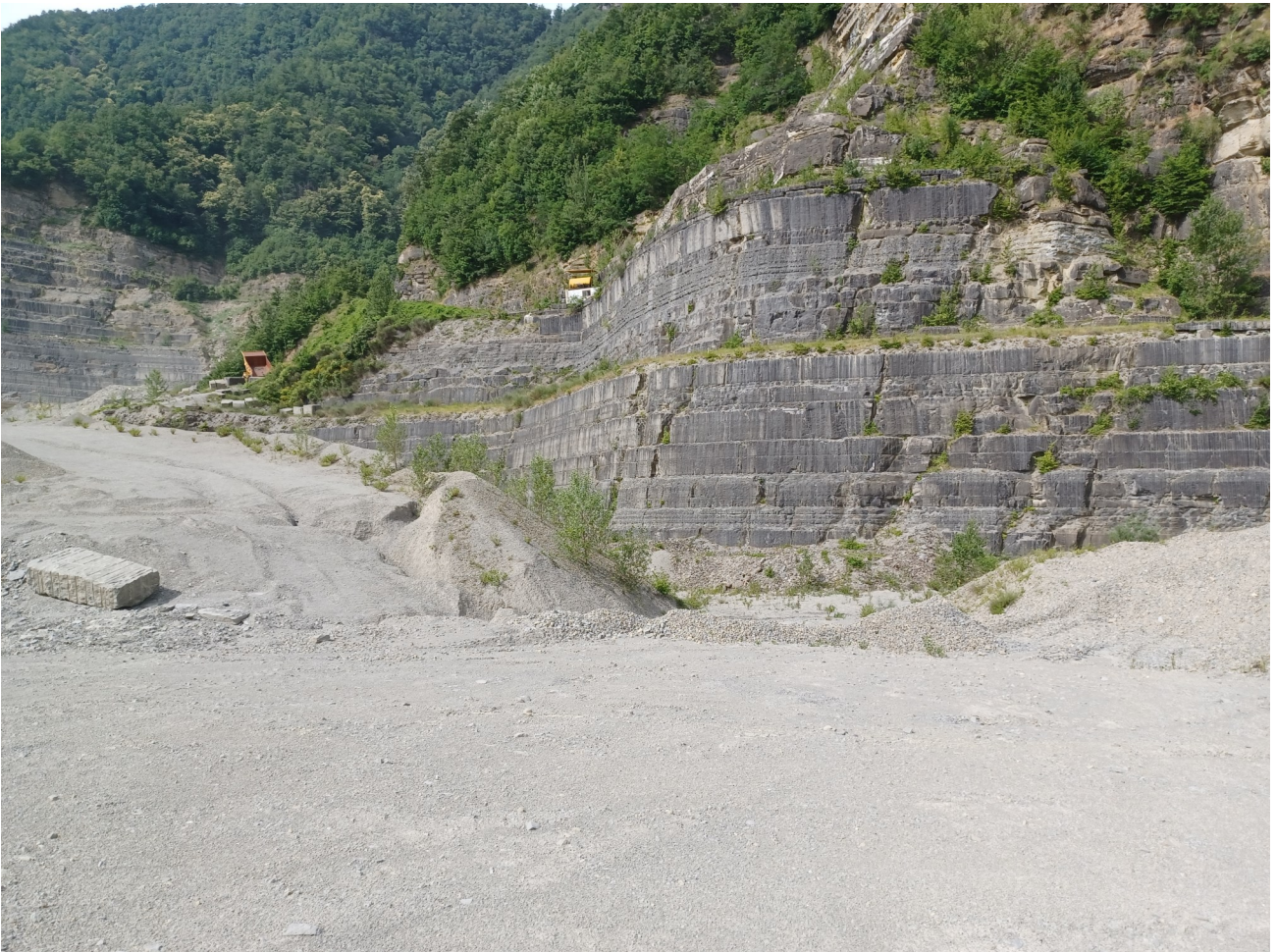
Immagine 6: vista vecchio piazzale da nord—dettaglio