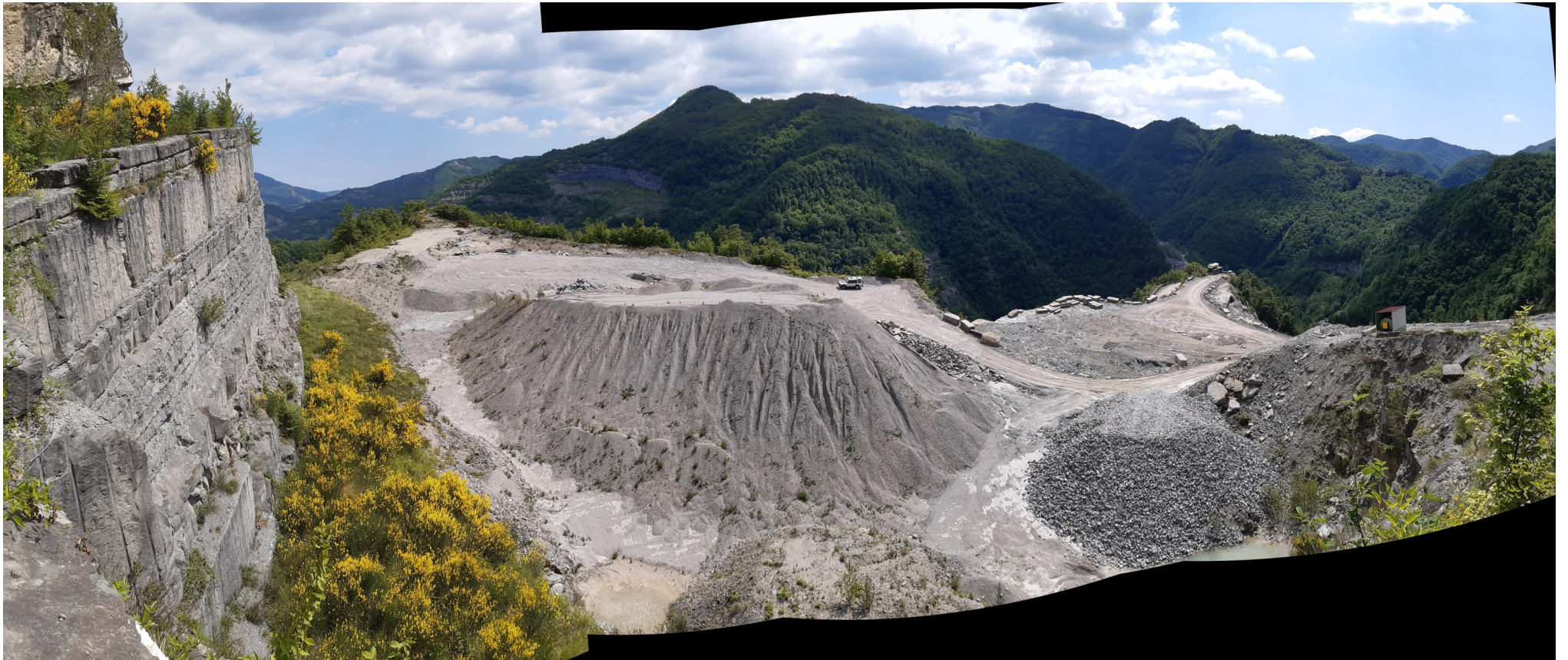
Immagine 16 : dal fronte N della Castellina vista panoramica sul piazzale Castellina