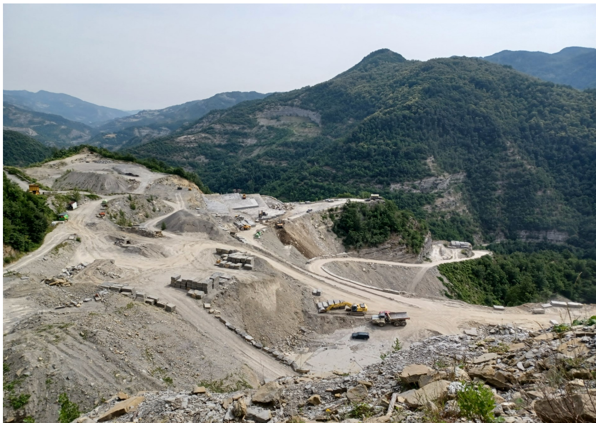
Immagine 1 : vista presa dalla cava Nuova Castelliina