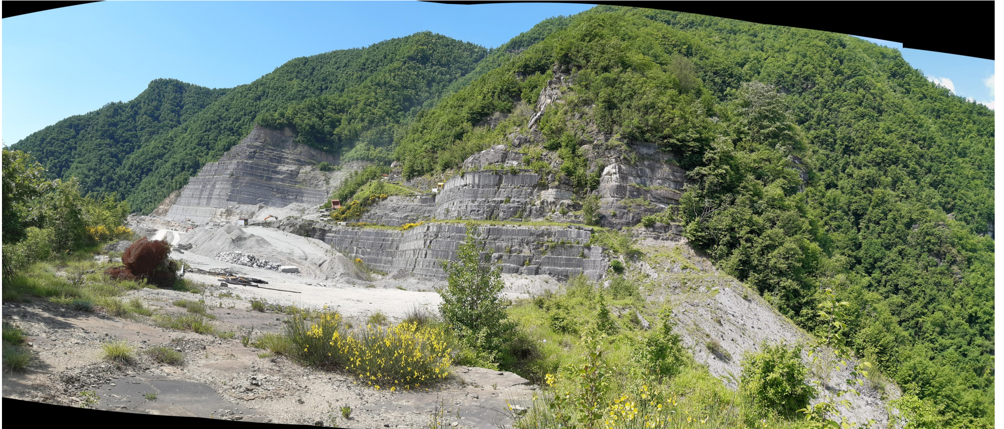
Immagine 15 : dallo spigolo SO della Castellina vista panoramica sul vecchio fronte