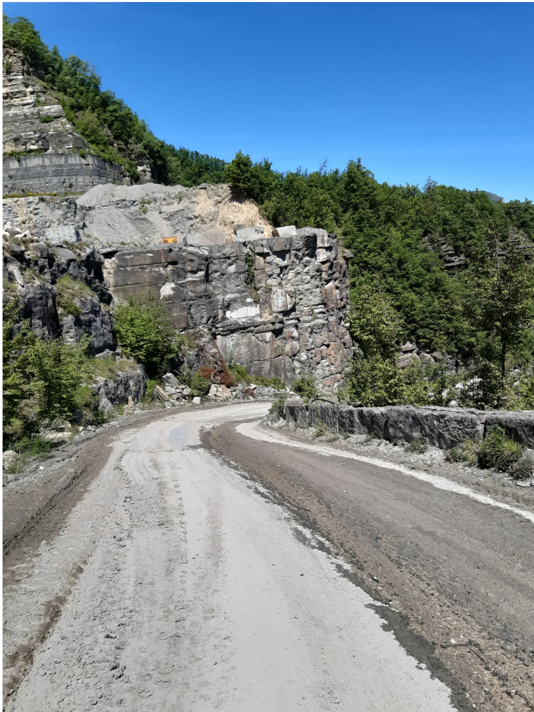
Immagine 14 : parte terminale della strada di arroccamento, vista sulla zona di arrivo in cava che sarà interessata dall'ampliamento