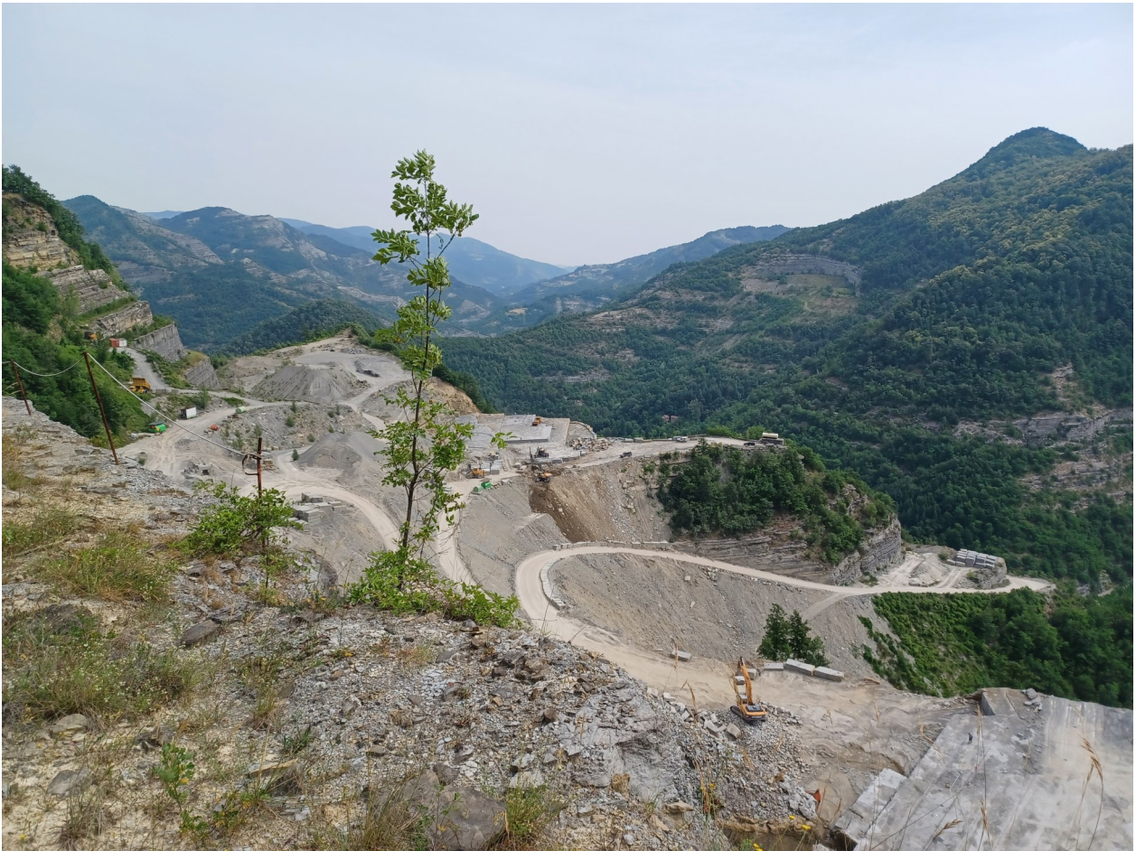
Immagine 9 : vista dalla porzione alta della Nuova Castellina verso la Castellina