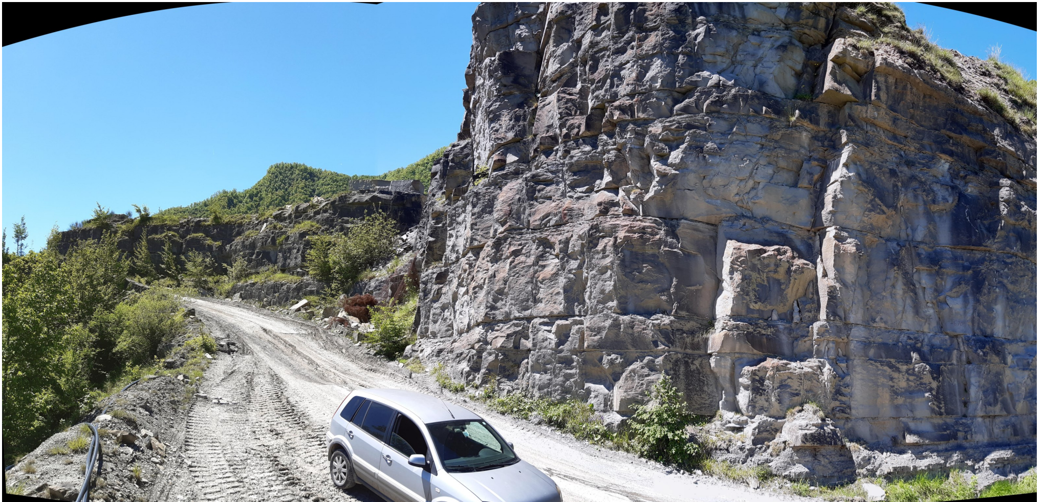
Immagine 13 : vista panoramica sulla zona di arrivo in cava che sarà interessata dall'ampliamento