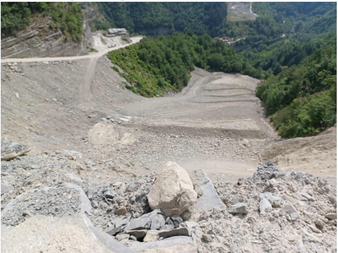
Immagine 10 : vista dalla porzione bassa della Nuova Castellina verso il piazzale in rilevato alla base della Castellina