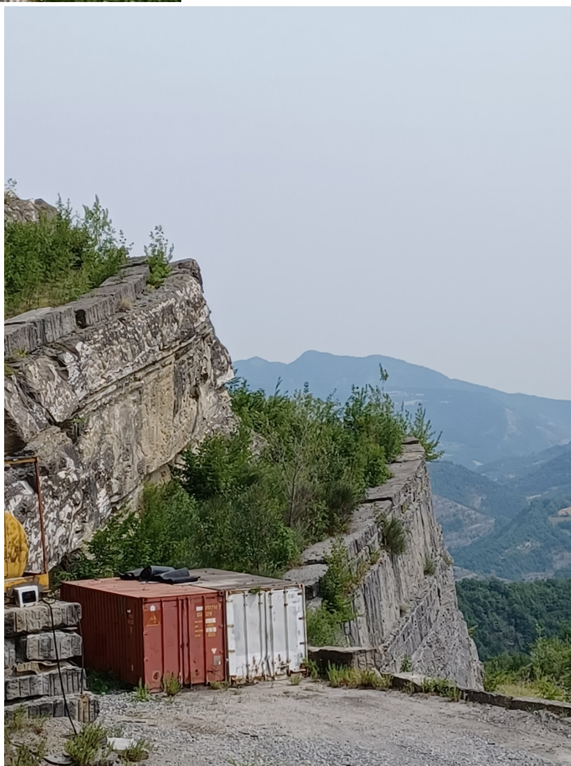
Immagine 8 : vecchi gradoni con Ripristino vegetale in affermazione