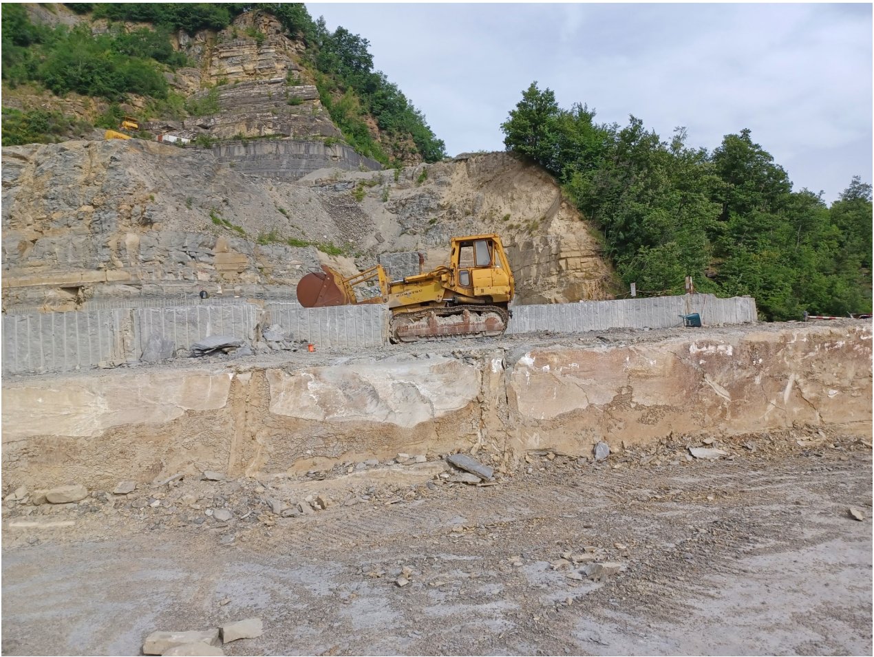
Immagine 3 : vista presa da ingresso cava—dettaglio filari in coltivazione