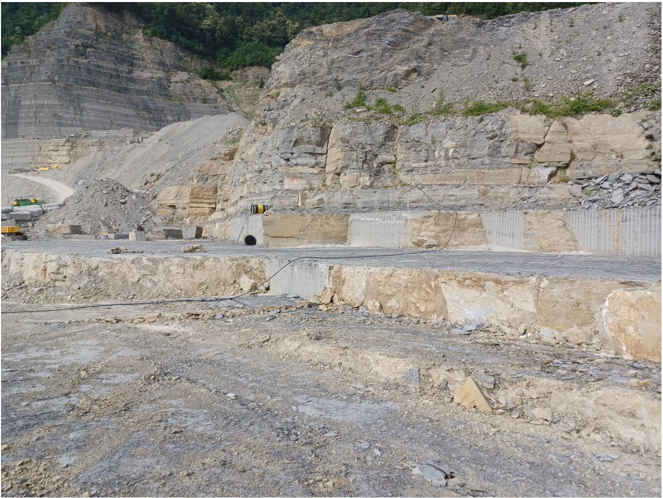
Immagine 11 : vista del fronte di scavo attuale castellina.