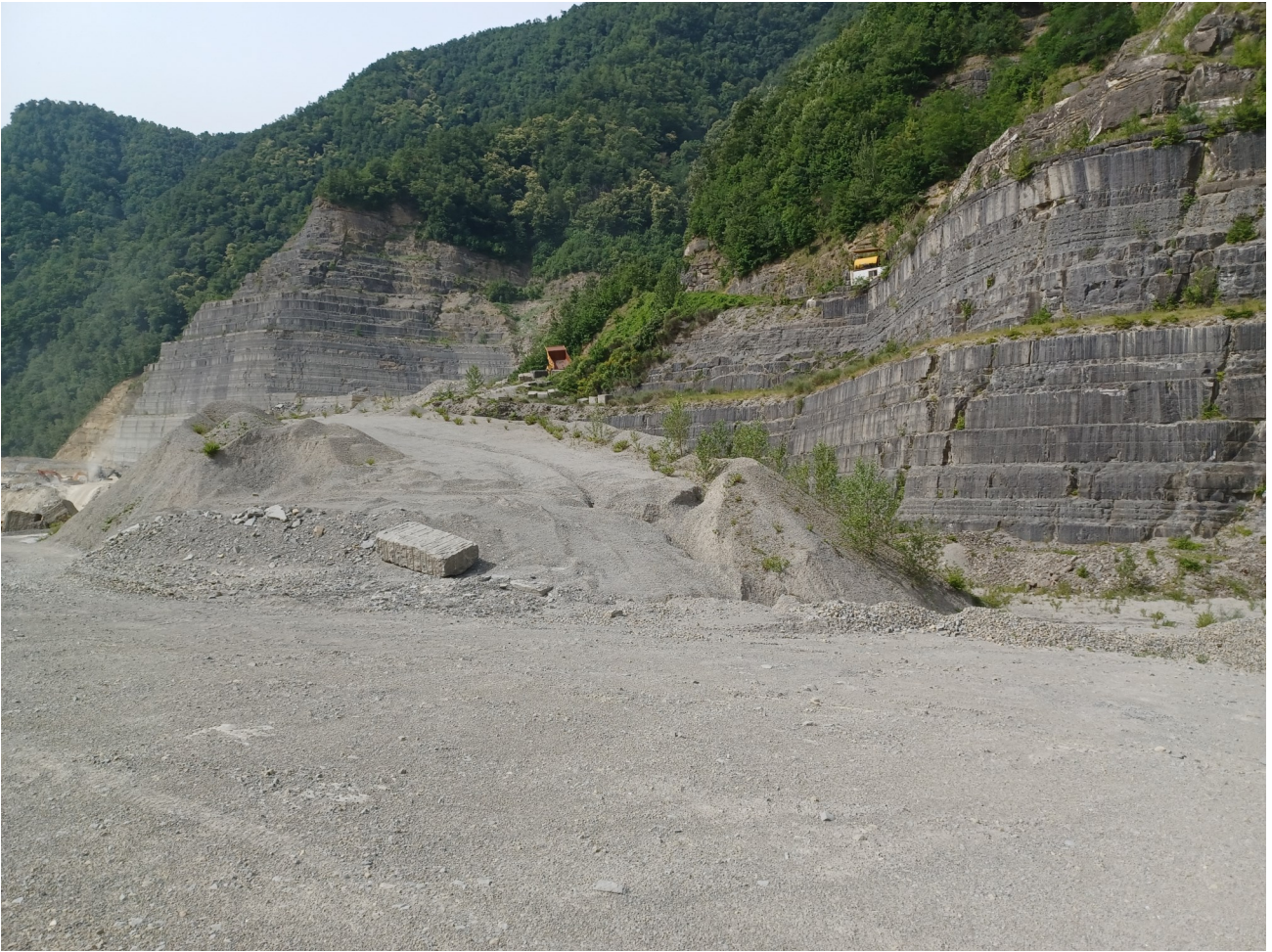
Immagine 5 : vista vecchio piazzale da nord